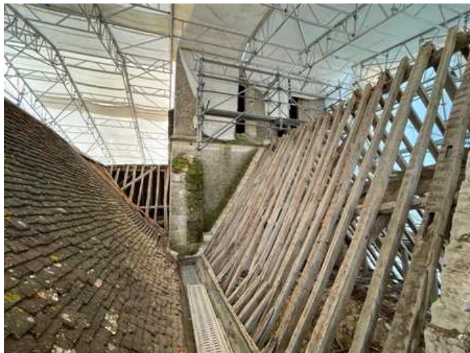
Il était temps, à chaque pluie la voûte était mouillée