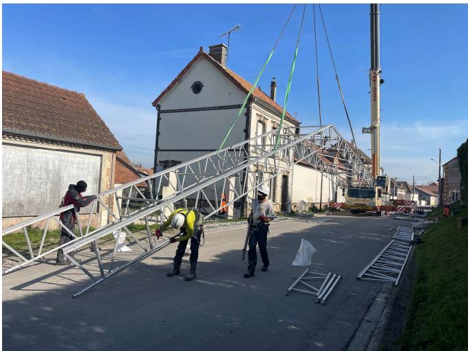
La route d'Arcis a été transformé une journée en chantier de construction