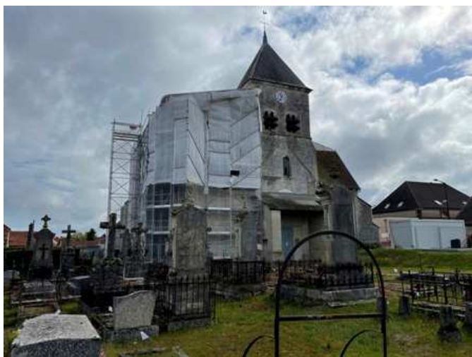
L'Eglise parée de son « parapluie »