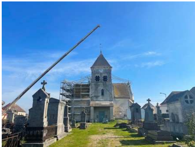
De la route d'Arcis, il déposait la couverture de l'échafaudage de l'Eglise