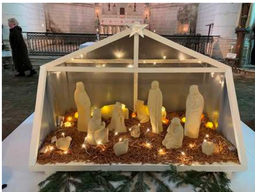
La Crèche rénovée