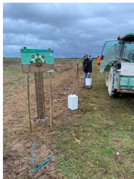
L'employé communal et les 2 adjoints ont plantés la haie