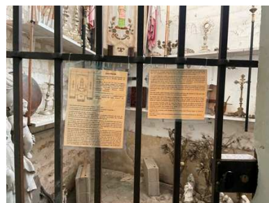
Le trésor de notre église