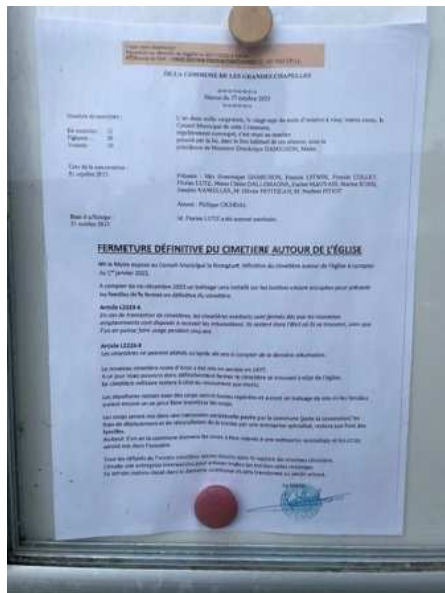
Panneau d'affichage de l'église

Les tombes de l'ancien cimetière ont toutes une affichette comme ci-dessous