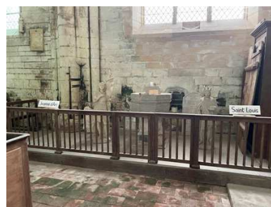
Jeanne d'Arc et Saint Louis