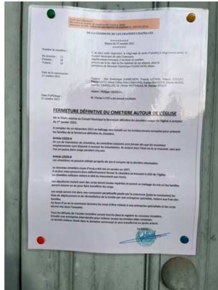
Portes en bois de l'église