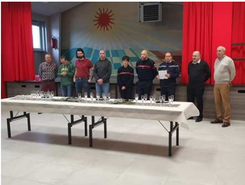
Tout le monde à l'écoute du chef du CPI

L'Amicale des Sapeurs Pompiers remercie chaleureusement les habitants pour leur générosité témoignée lors de la présentation et de la distribution de son calendrier 2024.