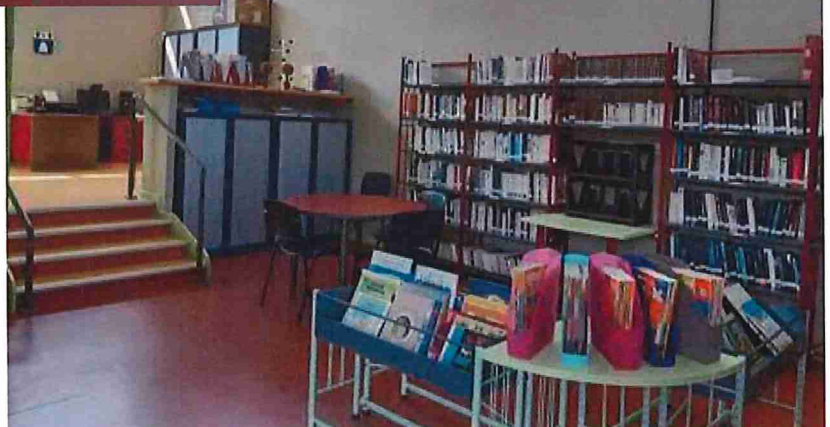
La bibliothèque enfant et adulte