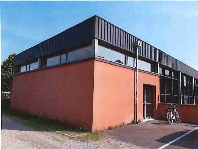
La bibliothèque vue de l'extérieur