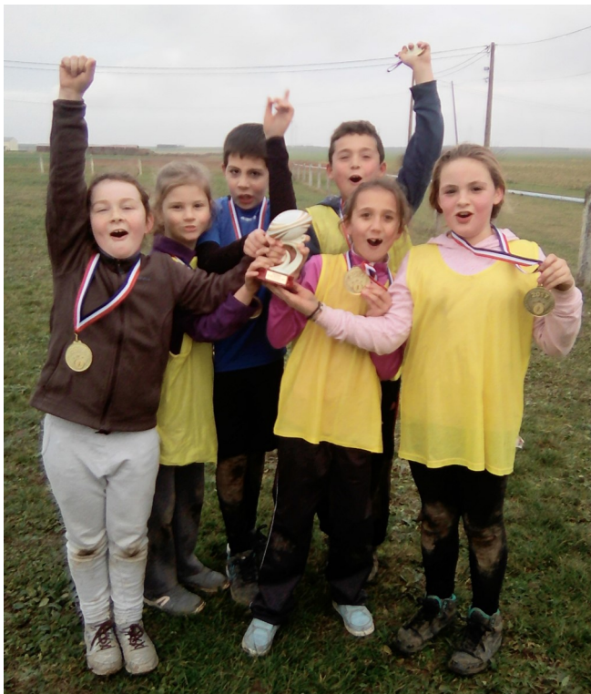
L'équipe victorieuse du tournoi : les Vipères !