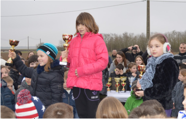
Podiums CE2 filles et CE2 garçons