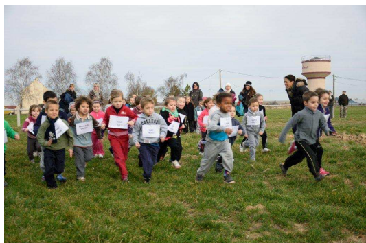
C'est parti pour les élèves de Grande Section !

Voici quelques photos souvenir du cross inter-écoles des Grandes Chapelles qui a réuni plus de 230 élèves sur l'ensemble de la journée du mardi 18 février.