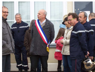
M. le Maire supervise les opérations