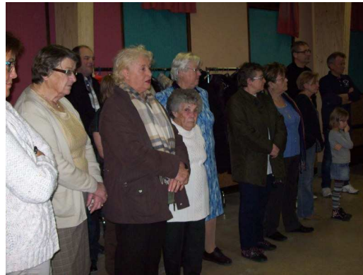
Un public attentif ...