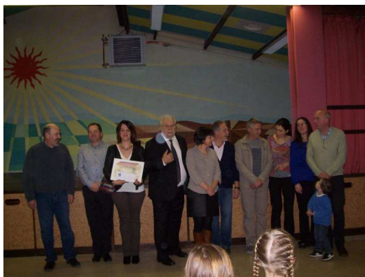
La remise des prix du fleurissement.