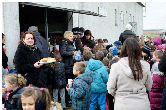
Hum, que c'est bon ... Merci les mamans !