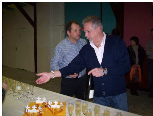
Place à la dégustation !