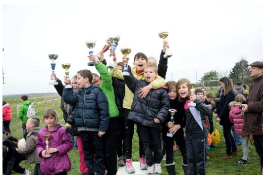
Razzia chez les Chapelats !

Les prochains événements sportifs sont prévus le vendredi 13 juin sur le terrain des sports de Sainte-Maure avec un maxi tournoi de Handball avec tous les élèves du CE1 au CM2, ainsi que la rencontre athlétisme à Prunay-Belleville le mardi 01 juillet.