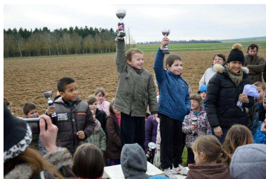
Sourire aux anges !