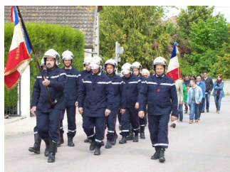
Défilé entrepris par le corps de sapeurs pompiers des Grandes Chapelles