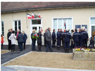
Rassemblement de la foule devant la Mairie

Vous êtes venus nombreux pour cette première commémoration de l'année 2014 dont voici quelques photos :